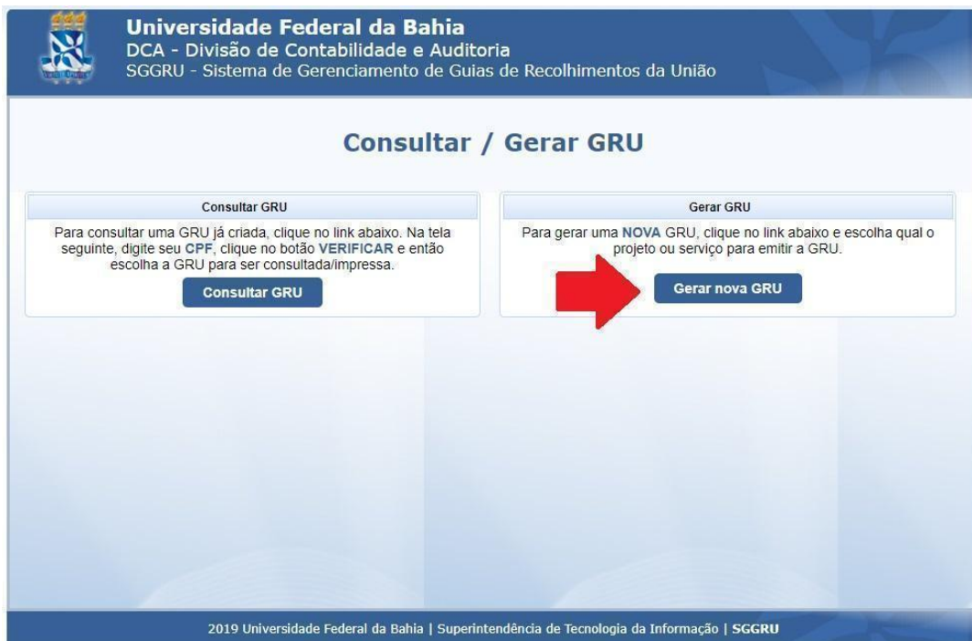
Figura 2. Passo 2 para a geração da GRU.