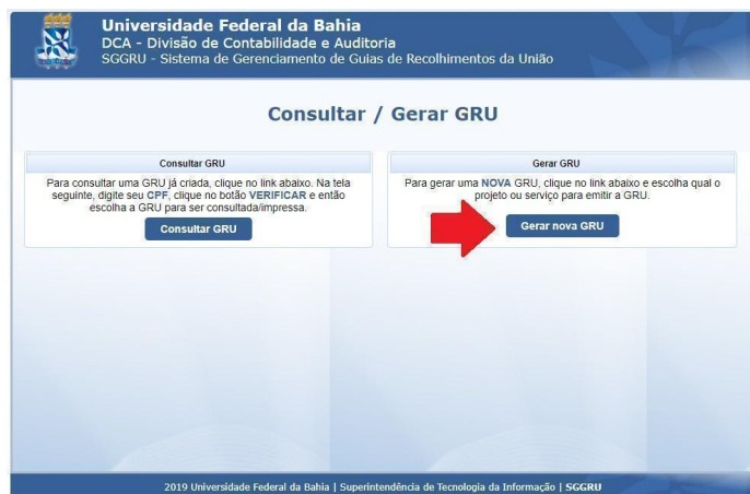
Figura 2. Passo 2 para a geração da GRU.