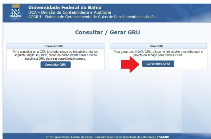
Figura 2. Passo 2 para a geração da GRU.

3.5. Documentos ilegíveis, que não correspondem ao conteúdo solicitado pelo campo ou documentos não-oficiais (históricos, diplomas, certificados, etc), não serão aceitos.