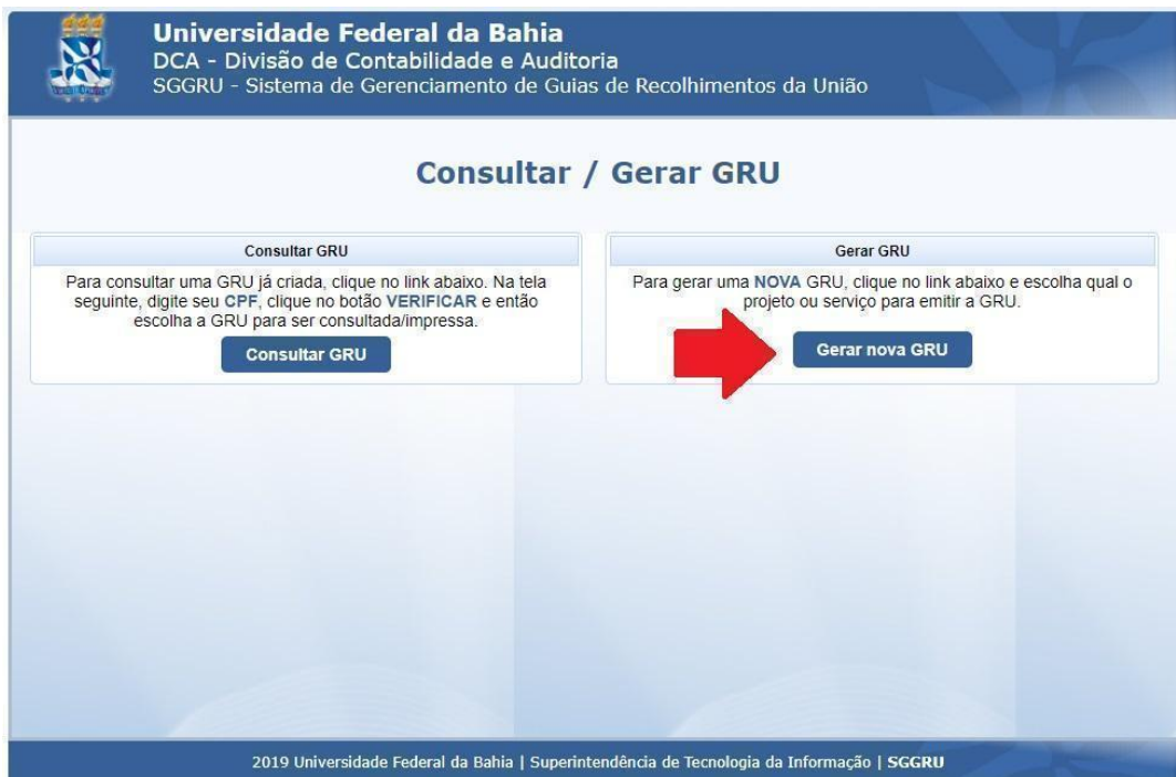
Figura 2. Passo 2 para a geração da GRU.